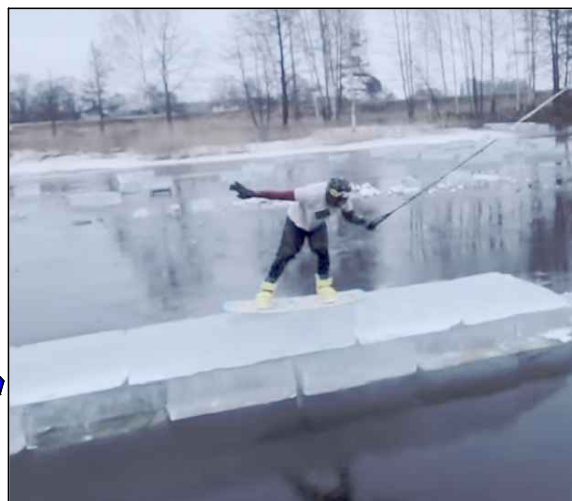
Piemērs: veikparks ziemā