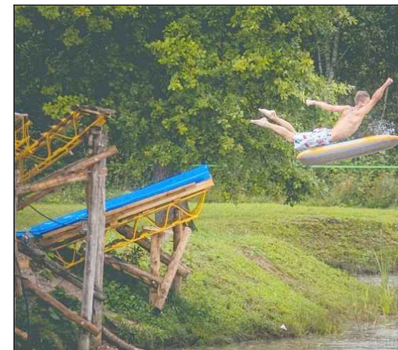
Piemērs: waterjump sistēma