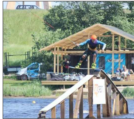
Piemērs: Lucavsalas veikparks