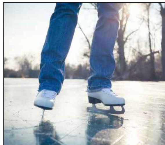
Piemērs: slidošanas iespējas ziemā