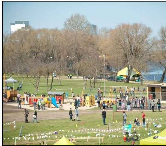
Piemērs: Lucavsalas sauszemes labiekārtojuma elementi