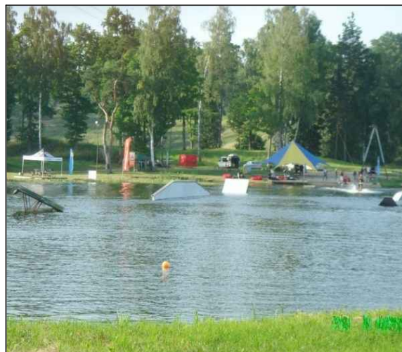
Piemērs: veikparka labiekārtojuma elementi